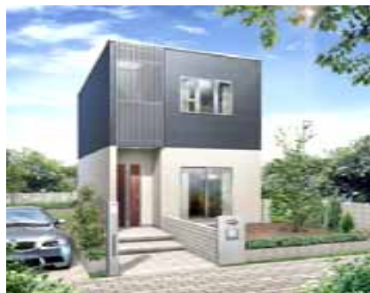
メゾネット・1棟単独